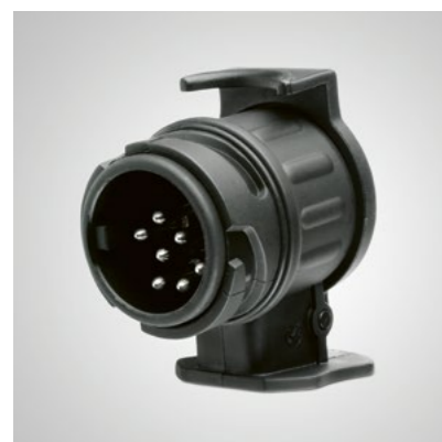
Art.-Nr. 99002-54Z00-027 Zum Verbinden von 7-poligem Stecker mit 13-poliger Buchse.