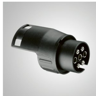
Art.-Nr. 99002-54Z00-028 Zum Verbinden von 13-poligem Stecker mit 7-poliger Buchse.