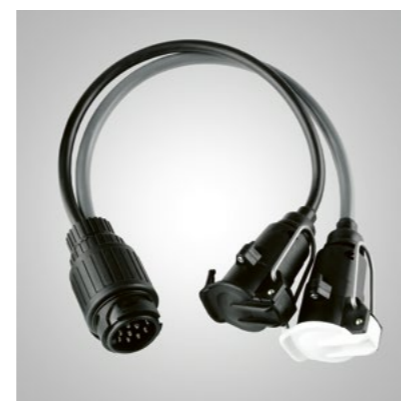
Art.-Nr. 99002-54Z00-026 Zum Verbinden von 12N/12S-Stecker mit 13-poliger Buchse.