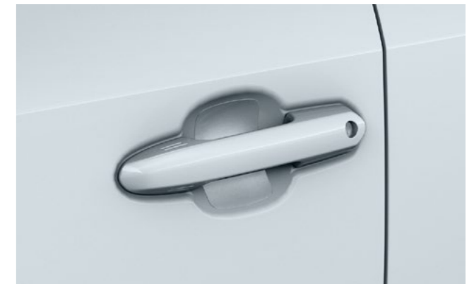
Art.-Nr. 99002-54Z00-043 Transparent, Set für die Fahrer- und Beifahrertüren, zum Schutz gegen Kratzer und Schrammen.