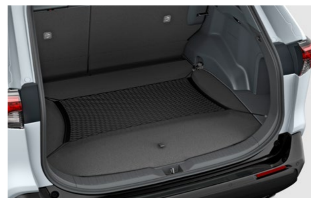
Art.-Nr. 99002-53Z00-002 Sichert Objekte im Kofferraum.