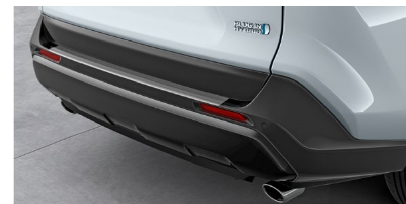
Art.-Nr. 99002-53Z00-028 Transparent.