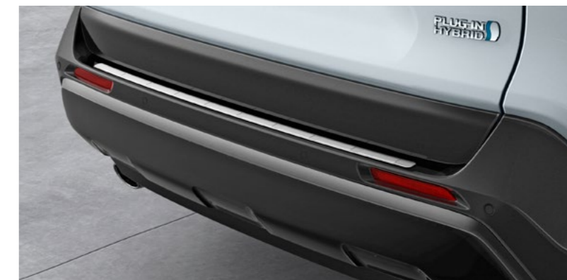
Art.-Nr. 99002-53Z00-007 Aus Edelstahl, Oberfläche gebürstet.