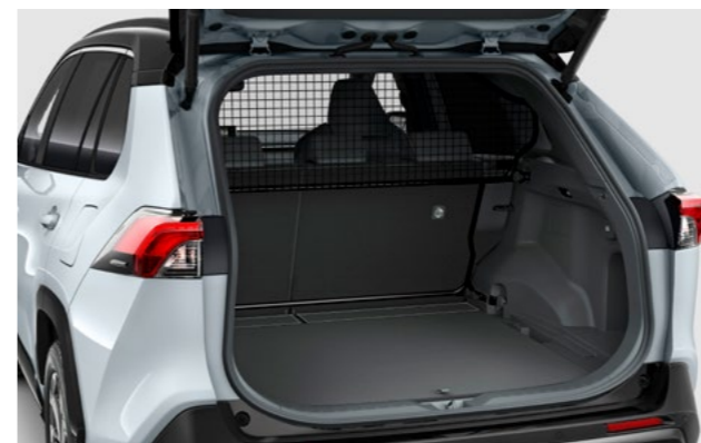
Art.-Nr. 99002-53Z00-003 Für die Trennung des Innenraums vom Laderaum.