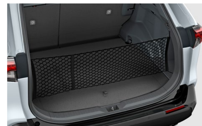
Art.-Nr. 99002-53Z00-001 Schützt Objekte vor dem Herausfallen aus dem Kofferraum während des Öffnens der Heckklappe.