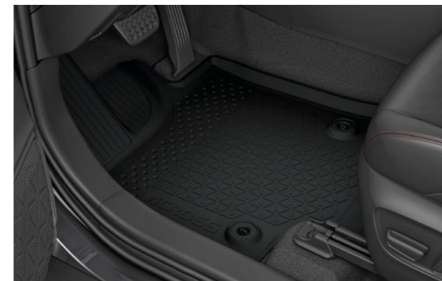
Art.-Nr. 99002-53Z00-027 4-teiliges Set, mit Across Logo.