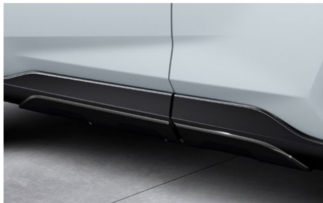
Art.-Nr. 99002-53Z00-023 Black mica.