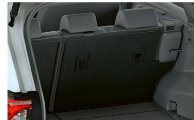
Art.-Nr. 99002-53Z00-025 Im Laderaum des Across können Sie viel verstauen. Je nach Art der Ladung besteht allerdings das Risiko, dass Ihr Ladegut die Rücksitzlehnen verschmutzt oder beschädigt. Mit unserem Rücksitzlehnen-Schutz lässt sich das elegant verhindern.