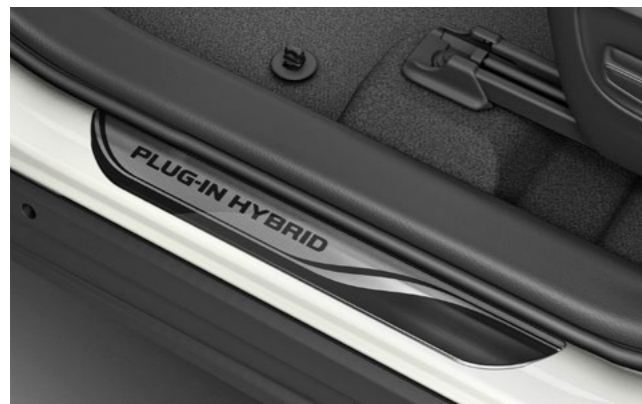
Art.-Nr. 99002-53Z00-016 2-teiliges Set, mit »PLUG-IN HYBRID« Logo.