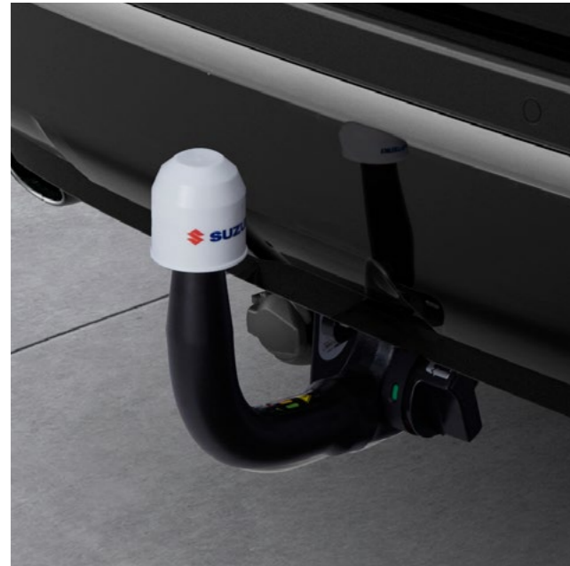
Art.-Nr. 99002-53Z00-011 Für Anhänger und Trägersysteme. E-Satz bitte separat bestellen.