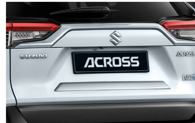
Art.-Nr. 99002-53Z00-008 Chrome.