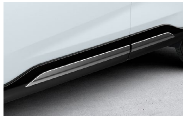
Art.-Nr. 99002-53Z00-009 Chrome, 4-teiliges Set.