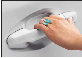
Türgriffschutzfolie Art.-Nr. 99002-54Z00-003