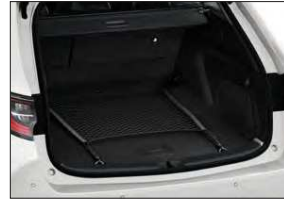
Gepäckraumnetz Art.-Nr. 99002-54Z00-001