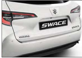
Ladekantenschutzfolie Art.-Nr. 99002-54Z00-004