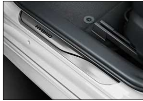
Einstiegsleisten-Set Art.-Nr. 99002-54Z00-020