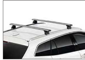
Grundträger 1 Art.-Nr. 99002-54Z00-019