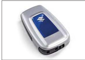
Schlüsselcover Art.-Nr. 99002-54Z00-016