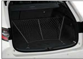
Gepäckraumnetz »VERTIKAL« Art.-Nr. 99002-54Z00-002